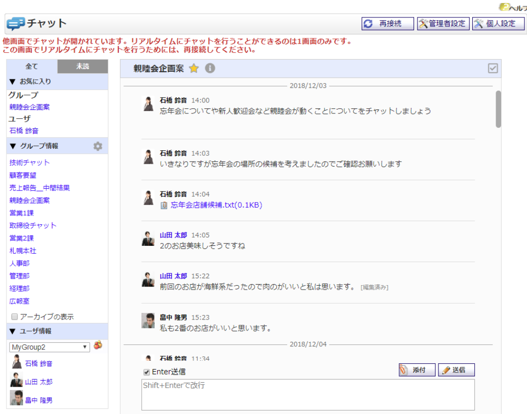
エラーメッセージ表示例

リアルタイム表示は、1ユーザにつき1画面でのみ正常に動作します。 そのため複数タブ、複数ウィンドウ、複数ブラウザ、複数端末など同ユーザで1画面以上表示をした際には1画面のみ正常に動作し、他画面ではエラーメッセージが表示されます。