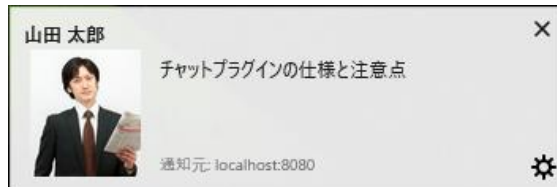
Firefoxを利用した際のプッシュ通知の表示例